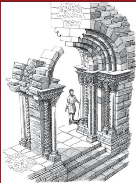
Francesco Corni - Sacra di San Michele, Portale dello zodiaco